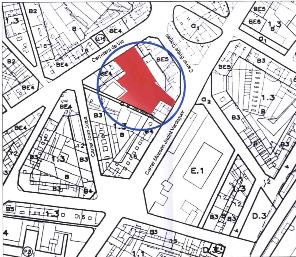
SITUACIÓ E: 1/1000