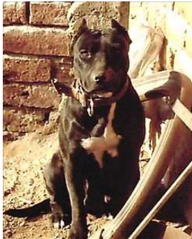
Pit bull terrier (american pit bull terrier, pit bull)