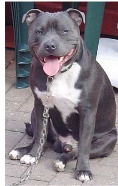
Staffordshire bullterrier (stafford anglès)