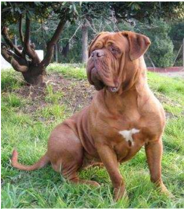
Dogo de Bordeus