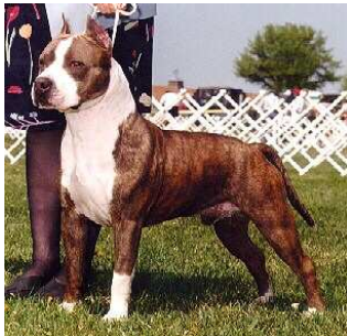
Terrier de Staffordshire americana (american staffordshire terrier)