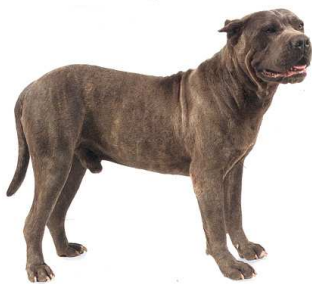
De presa canario