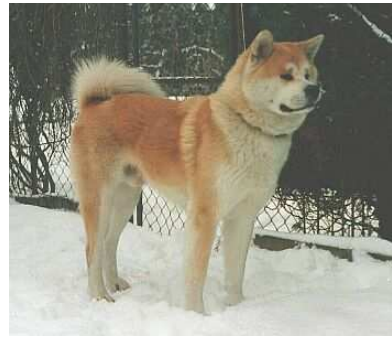
Akita inu (mastí japonès)