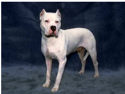
Dogo argentino (mastí argentí)